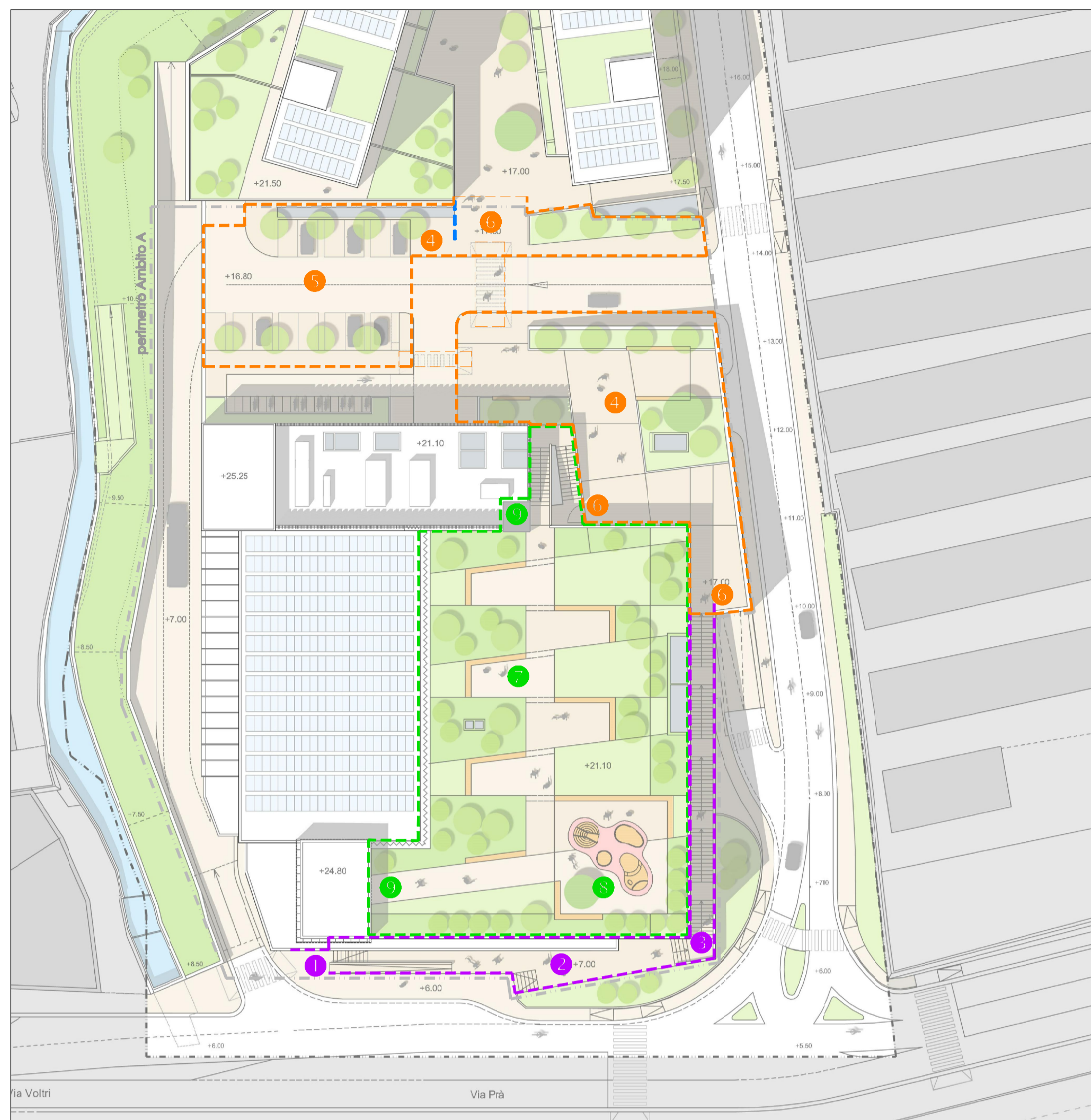
PLAN_GENERALE OPERE DI URBANIZZAZIONE SECONDARIA FASE 1 Superfici e Parcheggi ad uso pubblico, aree pedonali, aree verdi.