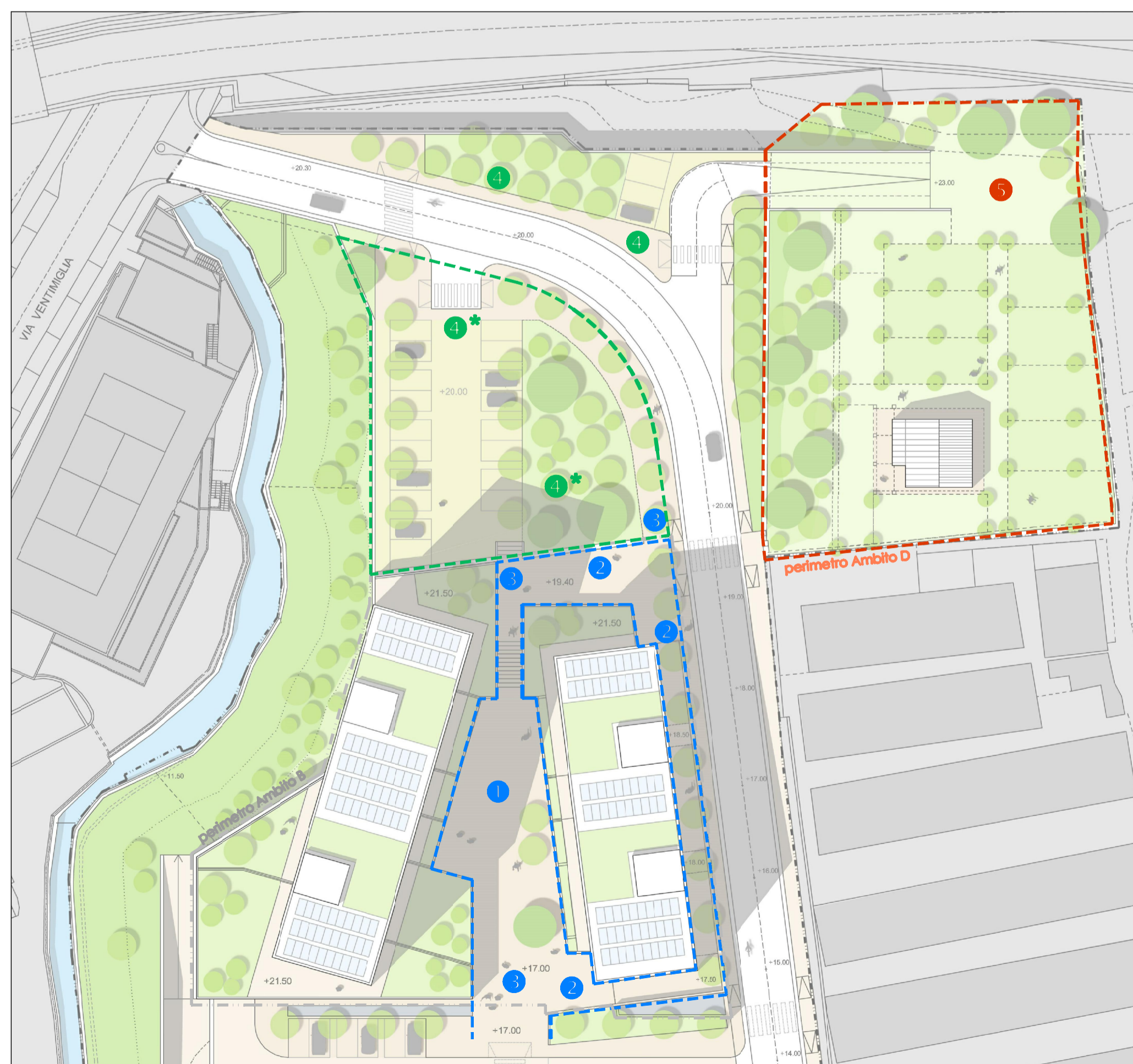
PLAN_GENERALE OPERE DI URBANIZZAZIONE SECONDARIA FASE 2 Superfici e Parcheggi ad uso pubblico, aree pedonali, aree verdi.